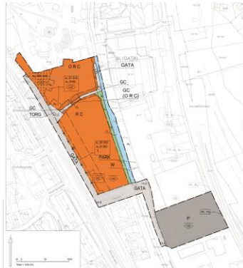
Etapp 1: Granskningsförslag 2018